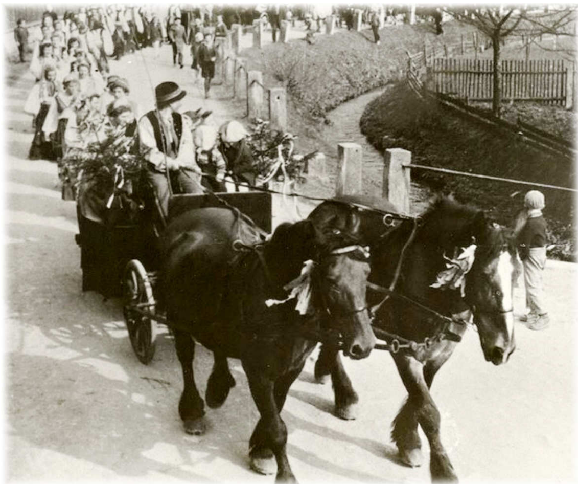
průvod v Řetůvce