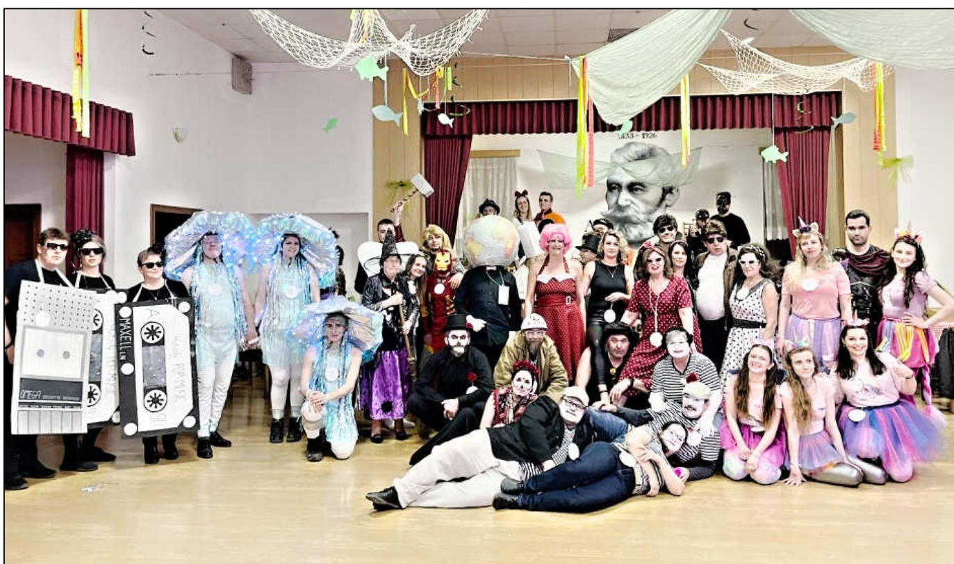
společná fotografie po vyhlášení ▼